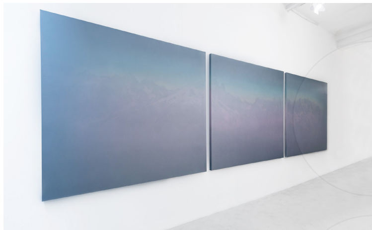
Johanna Perret, Lux Nova , 2019, Huile sur toile